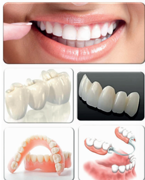
Alternativas de prótesis rehabilitadoras para la mejora en la eficiencia masticatoria y digestiva